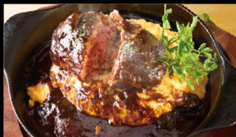
和牛ハンバーグオム ¥2,700