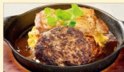
ハンバーグ& チキンソテーオム ¥1,890