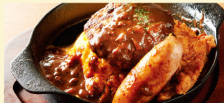
肉盛りオム ¥2,090 (ハンバーグ&ソーセージ&唐揚げ)