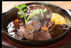
和牛ハンバーグ& ハラミステーキ オム ¥3,200