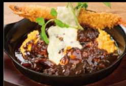
和牛ハンバーグ& 海老フライオム ¥3,100