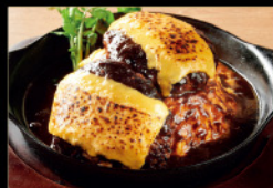
ダブルチーズ 和牛ハンバーグ オム ¥4,800