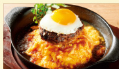
目玉焼き ハンバーグオム ¥1,590